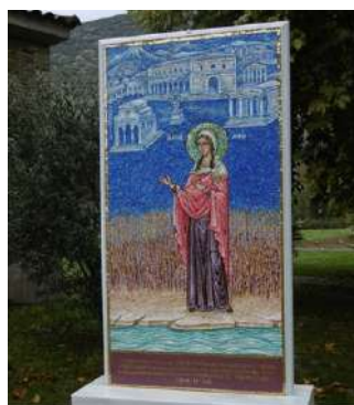
Site du baptême de Lydie À Philippiques

Saint Paul nous est apparu comme un assoiffé de Dieu, toujours en quête d'une conformité au Christ, un missionnaire et voyageur infatigable avec ses joies, ses déceptions lors de ses visites aux communautés chrétiennes naissantes. Il nous est maintenant plus familier, et ses écrits deviennent plus accessibles