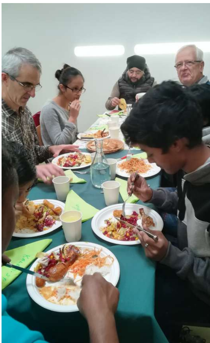
Table ouverte à Lozère

J'aime bien participer au repas collectif. Car on se réunit tous ensemble, avec nos amis et les bénévoles aussi. Il y a une ambiance très spéciale. On parle, on rigole. Et à chaque fois on découvre de nouveaux plats de différentes origines. Et la meilleure chose, c'est quand quelqu'un a besoin d'aide, il y a forcément un bénévole qui l'aide avec amabilité.