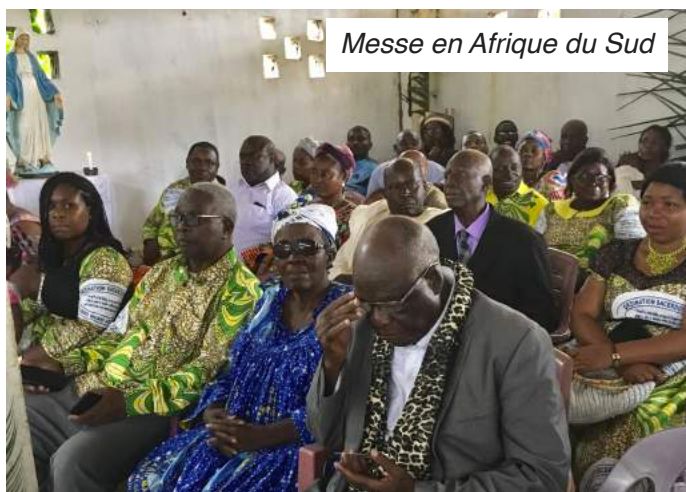
Messe en Afrique du Sud