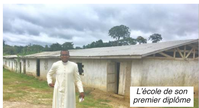
L'école de son premier diplôme