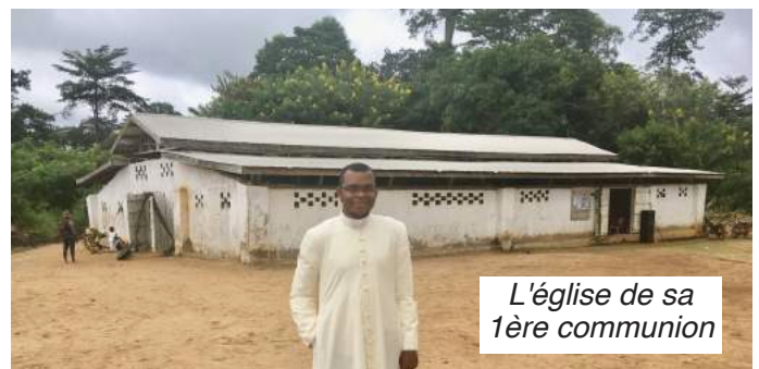
L'église de sa 1ère communion