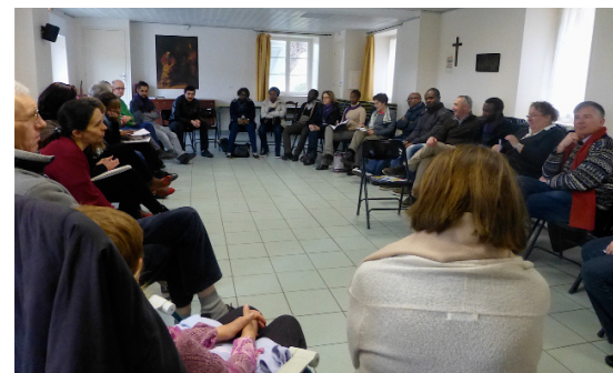
Réunion de baptêmes d'adultes

C'est pour cette raison que j'ai pris la résolution d'entamer ce parcours afin d'être en mesure de reconnaître sa présence dans ma vie et d'ouvrir mon cœur pour recevoir sa grâce.