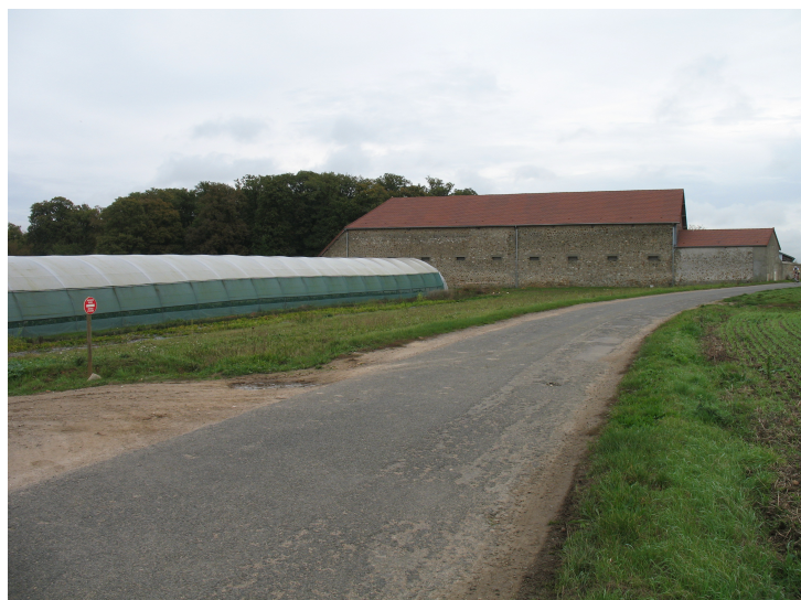
Les bâtiments et les serres du Jardin de Cocagne de Limon